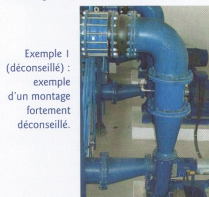
Exemple 1 (déconseillé) : exemple d'un montage fortement déconseillé.