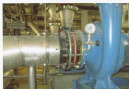
Exemple 2 (recommandé) : exemple d'un montage correct. L'effet de fond est compensé par des tirants.